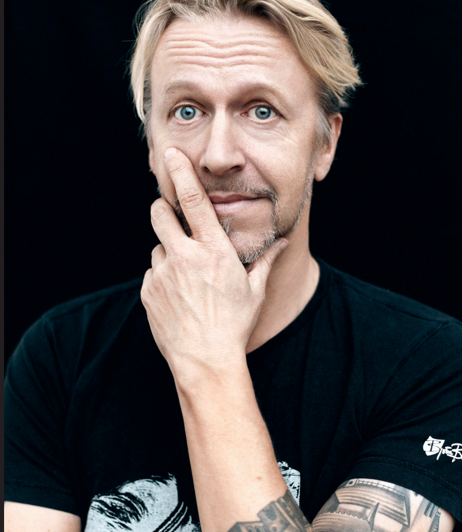
Bilden är beskuren.